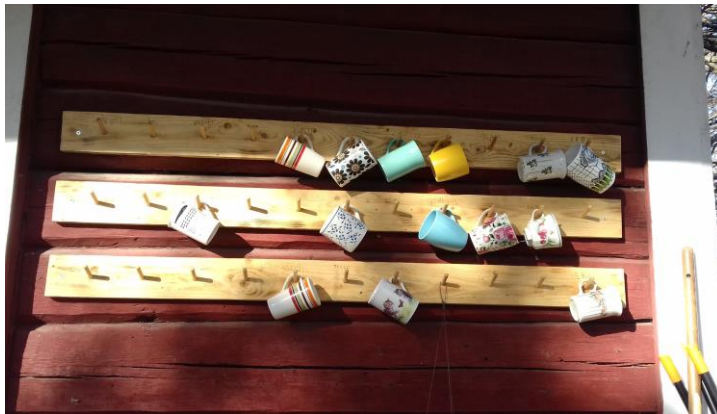
Kuva 2. Opinnäytetyön tekijän oma osallisuuden kokemus

Vihreä Telakan yhteisön työkaverit ja ohjaajat koettiin tärkeäksi. Vihreän Telakan yhteisöön oli ollut helppo mennä mukaan ja siellä oleminen ei ollut jännittänyt niin paljon kuin muualla aikaisemmin. Ohjaajien kerrottiin olevan kannustavia, rohkaisevia ja helposti lähestyttäviä. Joku kertoi jo tutustumiskäynnistä jääneen mukavan mielen, ”heti nämä ohjaajatkin tuntuivat niin kivoilta, minä sanoin, että kyllä minä haluan ehdottomasti tulla tänne töihin”. Yhteisön työkaverit koettiin ystäviksi tai kavereiksi, vaikka heidän kanssaan ei vapaa-ajalla oltukaan tekemisissä. Yhteisössä viihtymisen vaikutti muuan muassa kokemus ihmisten samankaltaisuudesta, ”täällä kaikki on samalla viivalla ja samantaisia rentoja”. Yksi haastateltu kertoi, että Vihreä Telakka on hänelle tällä hetkellä ainoa säännöllinen kodin ulkopuolinen toiminto, hänelle ”tämä on enemmän kuin mitä tuolla omalla ajalla oisin osa mitään”.